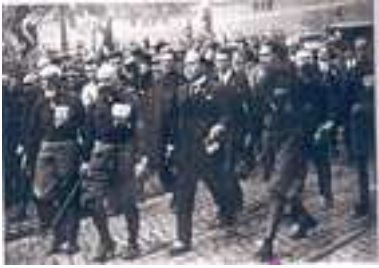
1- Mussolini en route pour présenter au roi son gouvernement, le 30 octobre 1922 lors de la marche sur Rome. À sa droite, Emilio de Bono et Cesare de Vecchi, à sa gauche, Italo Balbo