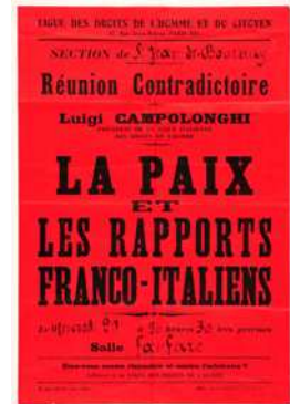
3- Affiche de la conférence de Luigi Campolonghi Saint-Jean-de-Bourney, 1934