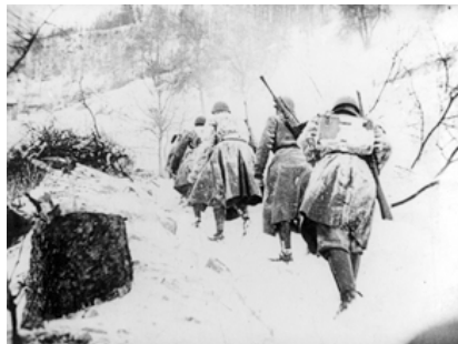
8- Fascistes de la « République sociale italienne » en opération contre les partisans, hiver 1944.