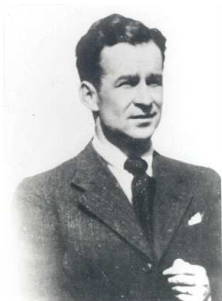
7- Antoine Polotti