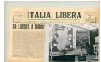
9- Grenoble, 3 octobre 1945 Exposition sur la Résistance italienne en Piémont, présentée à la Casa d'Italia