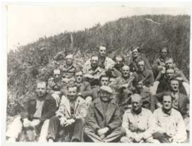
4- Fort-Barraux, Isère, avril 1941 Internés communistes sous le régime de Vichy dont un quart sont italiens.