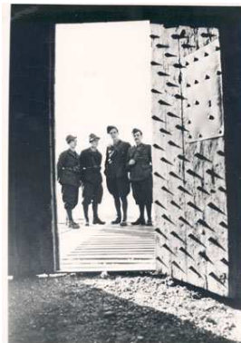
5- Grenoble, 1943 Soldats italiens à La Bastille.