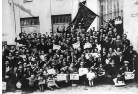
2- Participants du Congrès régional des Jeunesses communistes Grenoble, 1937